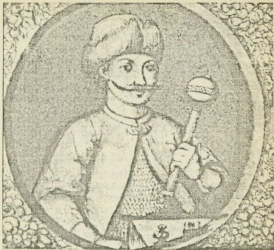
Портрет Гетьмана Івана Вигівського

нежитгездатною. Адекватно розцінював ситуацію і сам Вигівський. Ознайомившись із привезеним польським посланцем її варіантом, гетьман з гіркотою зауважив: «Ти зі смертю приїхав і смерть мені привіз...» 21 .