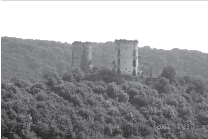
Башти Червоногородської фортеці

Так як замок розсипався і руйнувався, то князь вирішив поєднати минуле із сучасним, і перебудувати замок, частково використавши його мури для палацу. Дві башти і мури із заходу були розібрані, бійниці замінені на вікна, збудовано великий парник і гарну терасу.