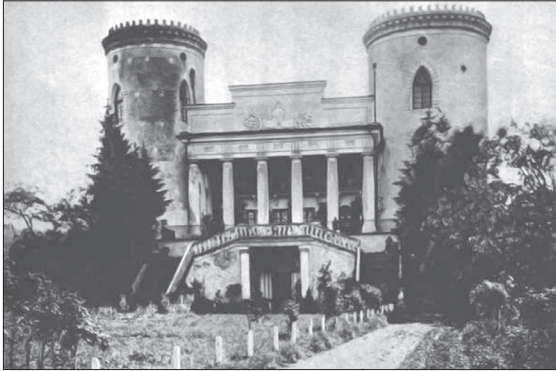
Червоногородський палац за результатами архітекторських перетворень Гелени Понінської

Дружині князя Понінського розказували про нещастя, що зазнавав Червоногород і Гелена увічнила їх пам'ятником серед парку, де колись стояв монастир отців Домініканів. Він існує і досі, але у доволі зруйнованому стані.