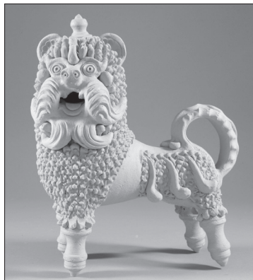
Омеляненко Василь. Лев. Глина, гончарний круг, ліплення, теракота. 59,5x54 см. Опішне, Полтавщина, 1976. Національний музей-заповідник українського гончарства в Опішному. Інв № кн-1213/к-1177.