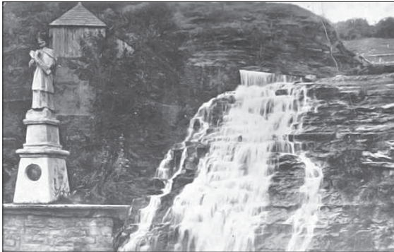
Вигляд водоспаду та пам'ятного знаку, зафундованого Геленою Понінською, світлина кінця XIX ст.

Після смерті князя Кароля, замок зазнав змін, правда, цілком невинуватих. Син Владислав зруйнував обидві вежі до фундаментів. На їх місці стали цілком нові башти, більші, збудовані в «готичному порядку», зі стрілочатими вікнами і прикрашені мереживною псевдоантикою.