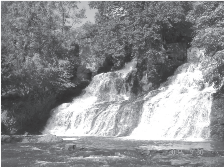
Червоногородський (Джуринський) водоспад сьогодні

Потім місто перейшло до родини панів Язловецьких. На жаль, у 1538 р. напав на ці землі молдавський господар Петро, здобутий замок було спалено, населення вимордовано або забрано у неволю. Вщент був зруйнований костел отців Домініканів, який більше не відродився в усій своїй красі. У XVII ст. панували тут Данилевичі. На місці дерев'яного замку вони збудували мурований. Це було чотирикутне приміщення з чотирма баштами на рогах, оточував будівлю оборонний мур з укріпленими брамами.