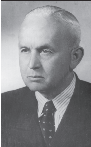
Олександр Цинкаловський