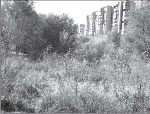
Так сегодня выглядит место, где возвышался храм Вознесения Господня в старом Александровске

ный). По воспоминаниям старожилов, при постройке дома по адресу бульвар Центральный, 22, за основу фундамента был взят фундамент старой церкви. Рядом с церковью находилось старое кладбище.