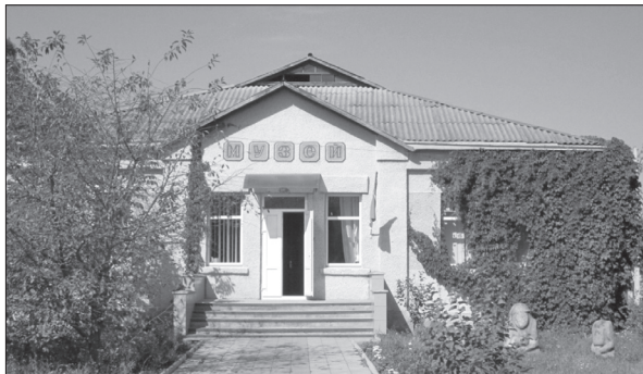
Будівля історико-краєзнавчого музею в м. Жашків.