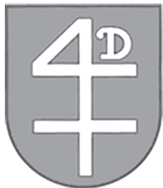
Сучасний герб Добротвора

Найдавніший відомий зараз відбиток добротвірської печатки на документі 1566 р. вмістив у своїй книзі «Печатки міст давньої Польщі» В. Віттиг. Вона була округла, радіусом 26 мм, з написом по кому (SI) GIL OPPI(DVM), що в перекладі з латини означає «міська печатка» чи «печатка міста». У колі описаний вище герб із перевернутою літерою «D». Це зображення збереглося на всіх відомих печатках, окрім печатки громадської ради Добротвора від 1888 р., де форма D замінена двома дугами. Печатки XVIII–XIX ст. мають ще деякі відмінності від найдавнішої: на них фігура четвірки нагадує двораменний хрест, з верхнім і нижнім раменом, а нижнє рамено, що пересікає вертикаль четвірки, має хрестовинні завершення.