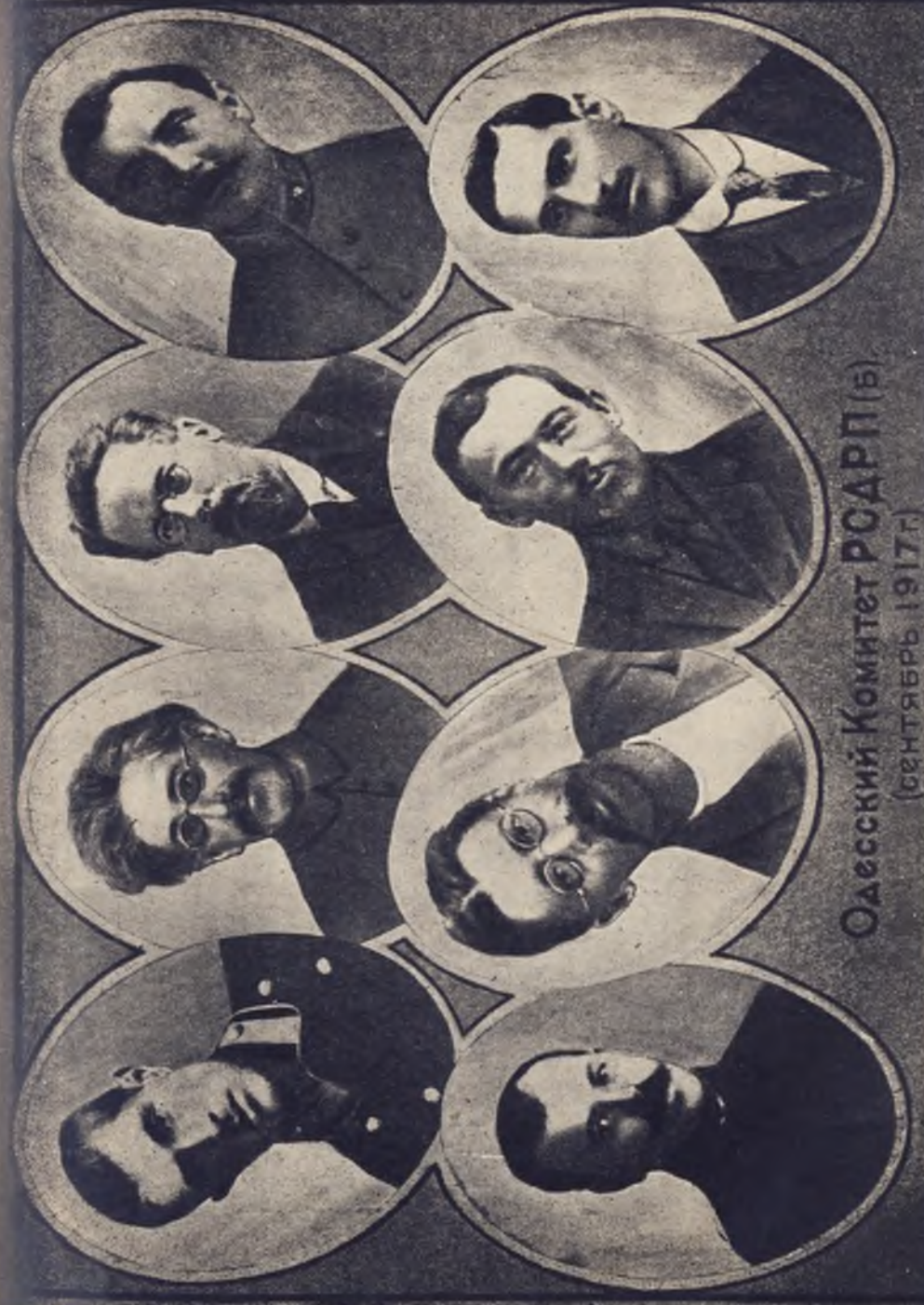
Одесский Комитет РСДРП (в) (сентябрь 1917г)