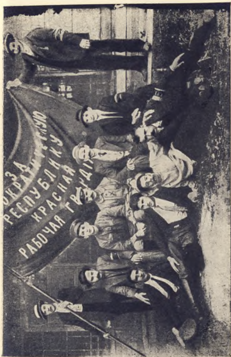
Штаб Одесской Красной гвардии 1917 года (до декабрьских боев)