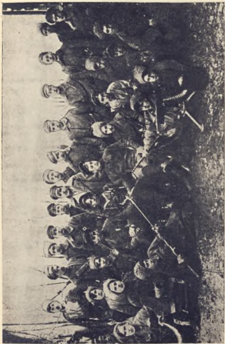
Отряд харьковских красногвардейцев на калединском фронте