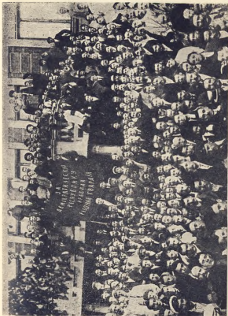
Одесская Красная гвардия в 1917 году