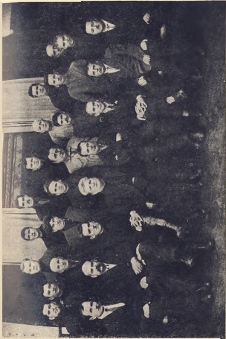
Группа активных участников Октябрьских дней в Донбассе.