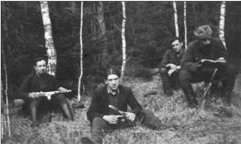
Повстанці Золочівщини на пості