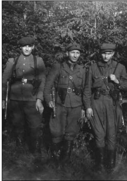
Неідентифіковані підпільники з Золочівщини