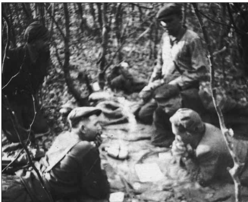
Повстанці Золочівщини на пості