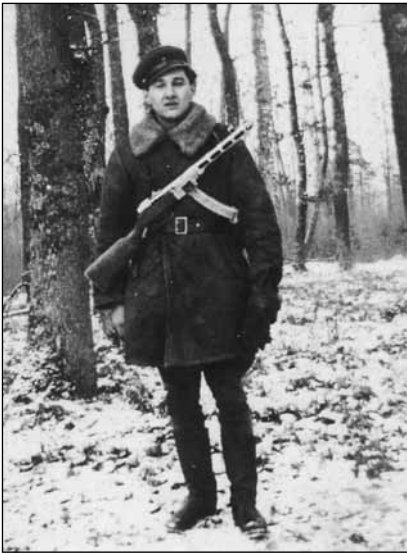
Невідомий підпільник із Золочівщини