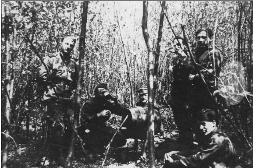
Повстанці Золочівщини на пості