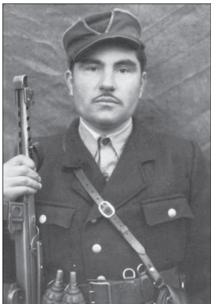
Провідник Любомльського району ОУН Богдан Сергій Кіндратович- "Биков". Волинська область.