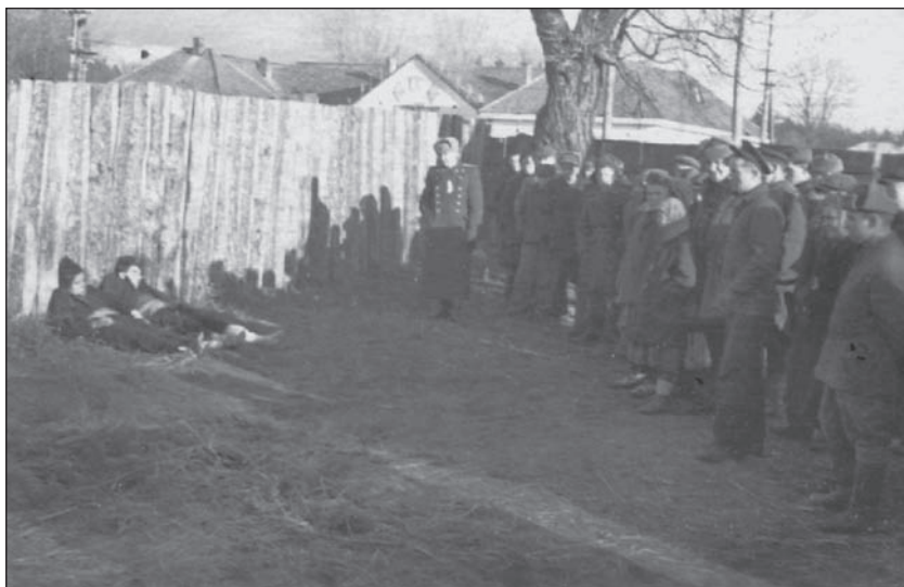
Убиті повстанці. Волинська область. 1940-і рр.