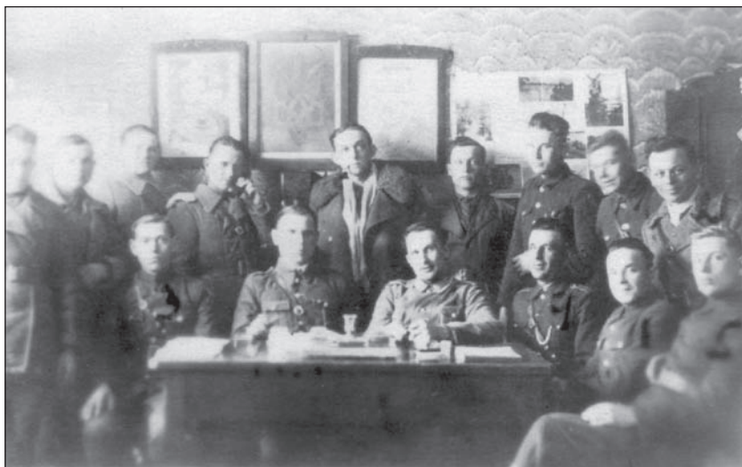
Група українських повстанців. Можливо – штаб якогось куреня УПА. Волинська область. 1940-і рр.