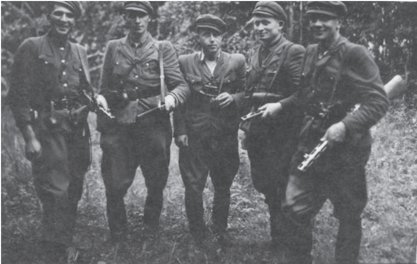
УПА на Волині. Невідомі повстанці. Кін. 1940-х – поч. 1950-х рр. (УСБУ Волинської обл., фонд кримінальних справ на осіб, які перебувають на оперативному обліку, спр. 17863)