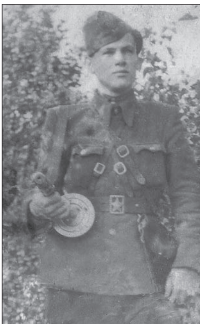
Киселик ("Сокіл") – провідник одного з підрайонів Вербського району ОУН. Рівненська область. 1951 р.