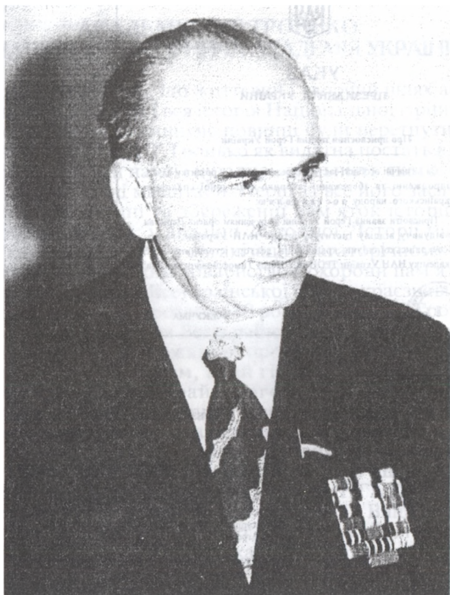
ПЕТРО ТИМОФІЙОВИЧ ТРОНЬКО До 85 – річчя з дня народження.