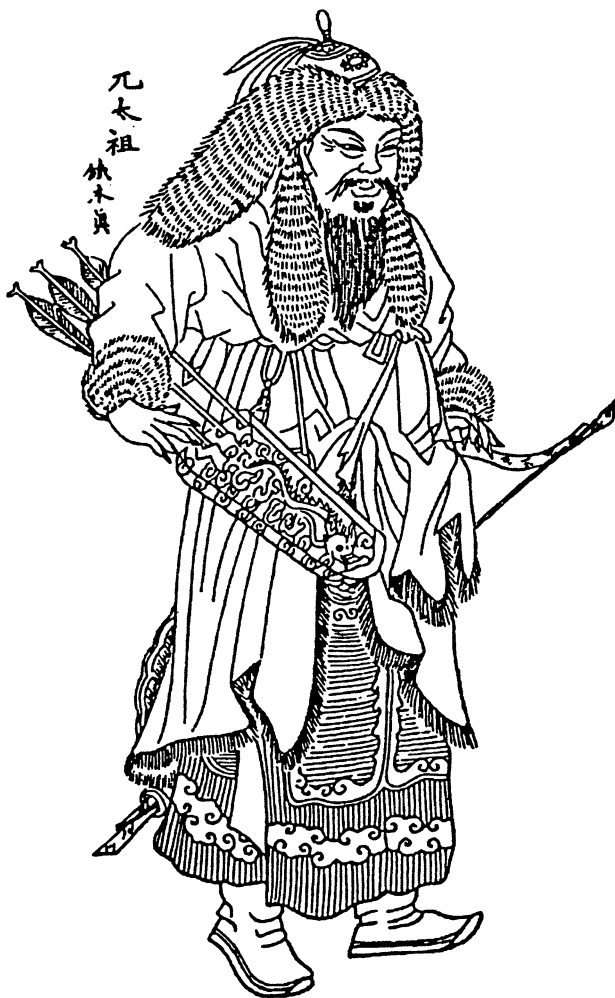
Чингіз-хан. З китайської мініатюри