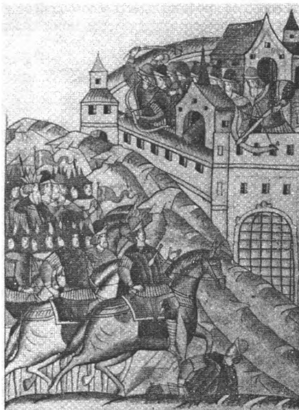
Облога Москви ханом Тохтамишем (1382). Мініатюра Остерманівського 2-го тому Лицьового зведення (XVI ст.)