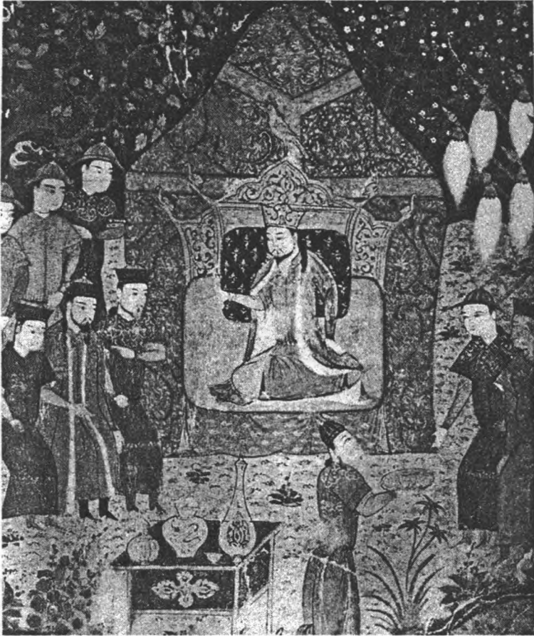
Коронація Чингіз-хана. Справа від трону Джучі. З мініатюри хроніки Рашід-ад-Діна.