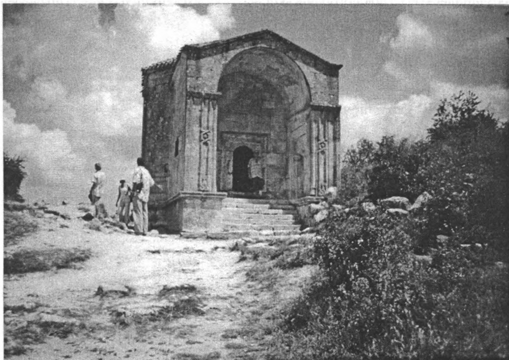
Дюрбе Джаніке-ханчі. Кирк-Ер, XV ст.