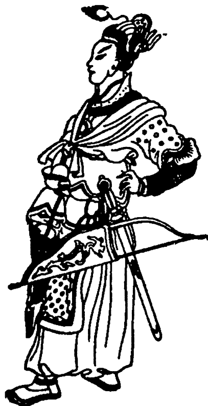
Хан Бату. З китайської мініатюри