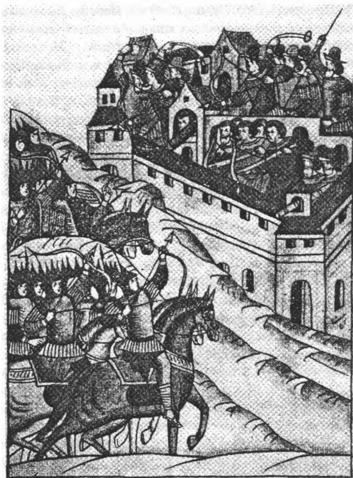
Облога Москви ханом Тохтамишем (1382). Мініатюра Остерманівського 2-го тому Лицьового зведення (XVI ст.)