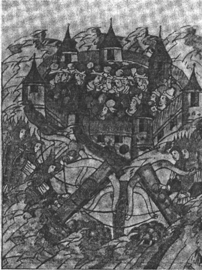
Облога Володимира ординцями (1238). Мінітюра Голіцинського тому Лицьового зведення XVI ст.