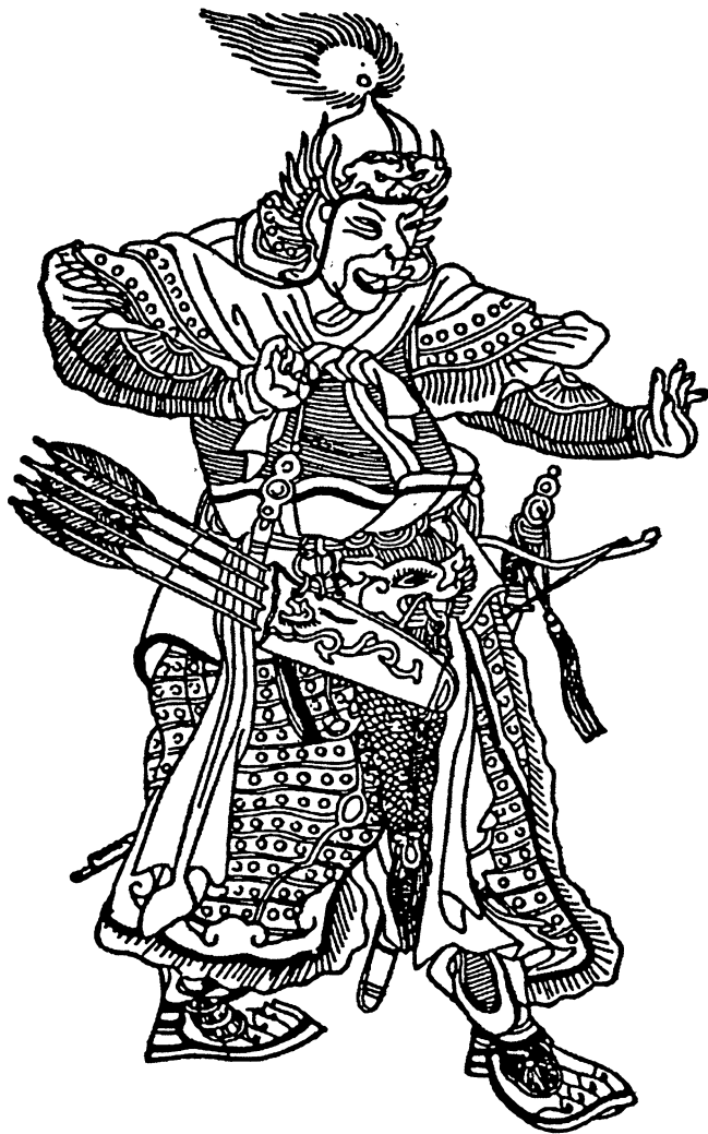
Субудай-багатур. З китайської мініатюри