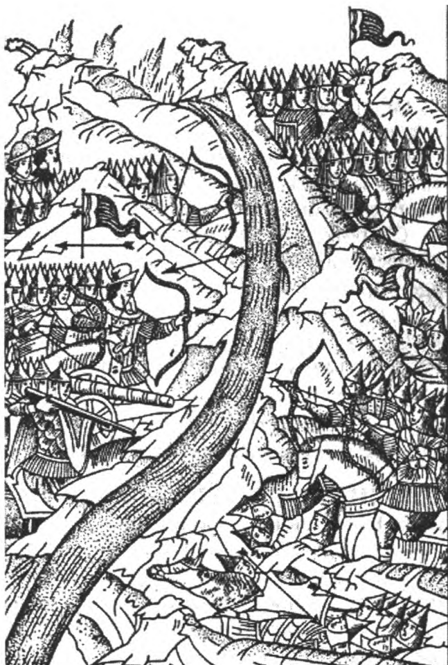
Стояння на ріці Угрі (1480 р.). З мініатюри Царственного літописця.