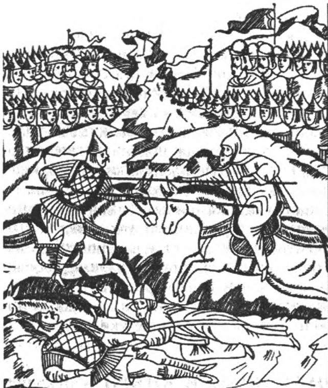
Поединок Пересвета з Темір-мурзою (Челібеем) (1380 р.). З мініатюри Царственного літописця.