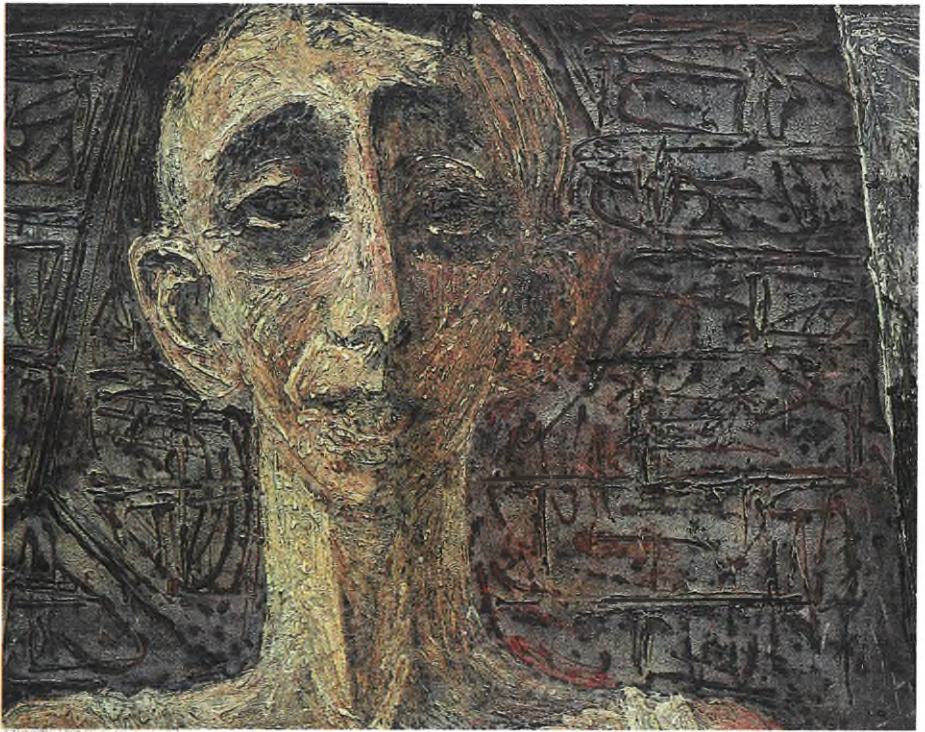
М. Вайнштейн ( 1940—1981 ) «Хлопчик з Освенціму», полотно, олія, 1966 р.

точаться найгостріші дискусії – вони стосуються всіх сфер життя, не виключаючи художньої.