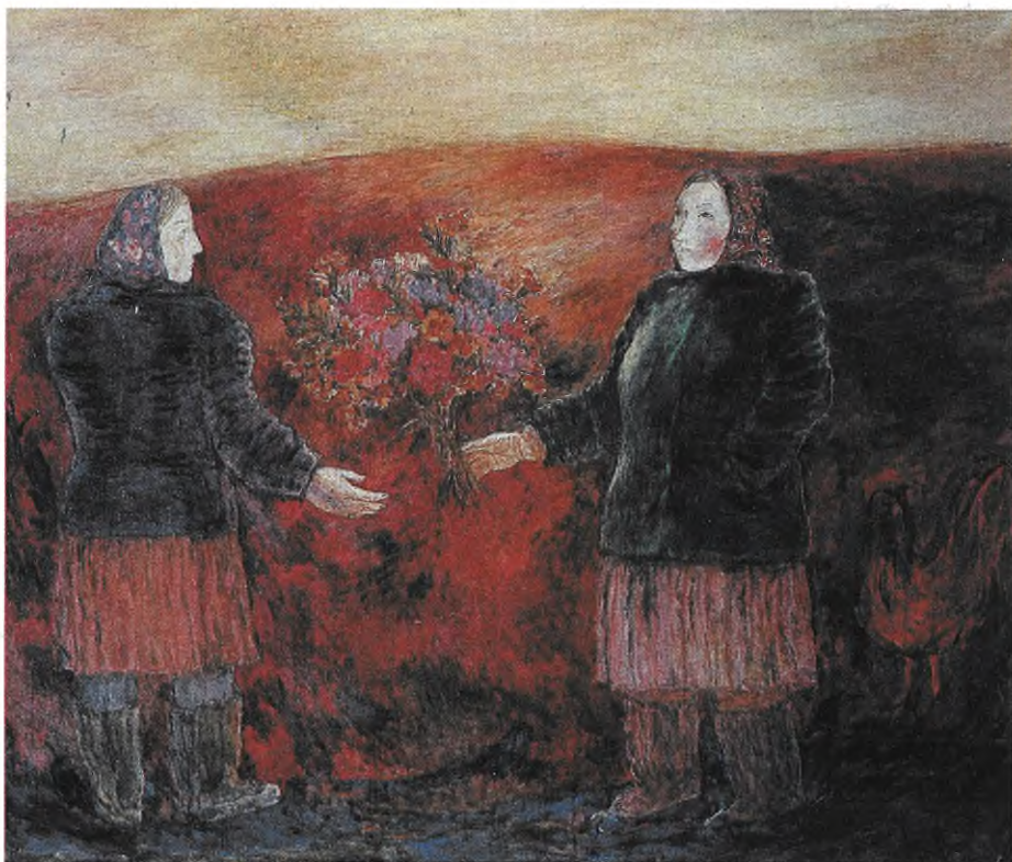
З.Лерман «Подруги», полотно, олія, 1980 р.

національність, а порядність, відданість справі були критерієм, за яким об'єднувалися люди. Ганебність антисемітизму цілком на совісті ідеологізованої верхівки Спільки художників.