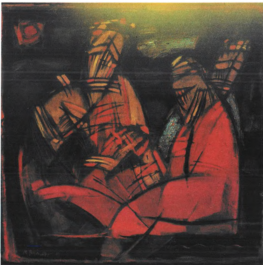
Дмитро Вайсберг «Двоє», олія.

народного мистецтва, вона вміє звичайний сюжет перетворити на розгорнуту метафору-притчу.