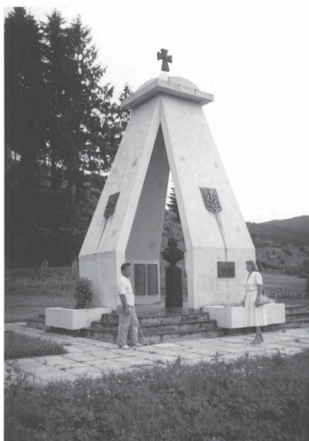
Пам'ятний знак на місці масових захоронень полеглих та закатованих повстанців: Млака, смт. Славське, 1995.