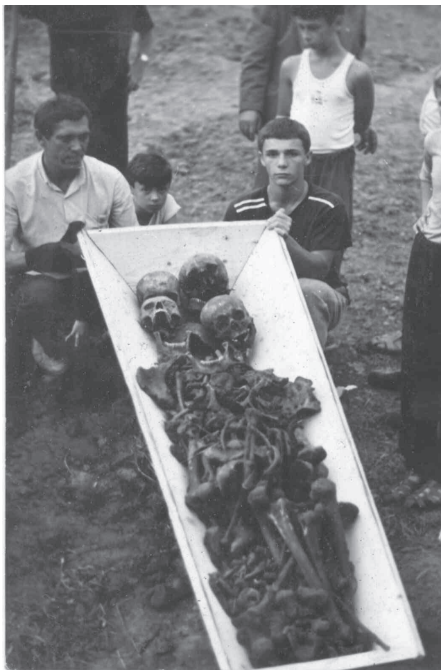
Перепоховання останків вояків УПА, вересень 1990, м. Старий Самбір.