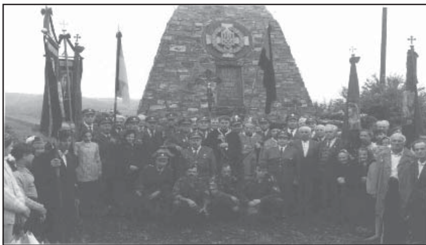
Фрагмент пантеону для перезахоронення останків полеглих повстанців, м. Хирів Старосамбірського району, 1996.